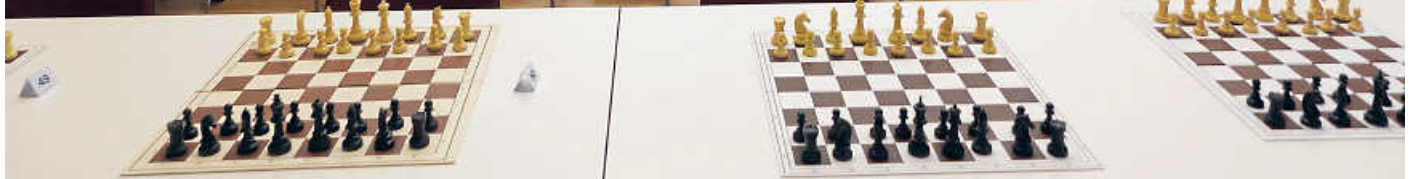
BaWue Schnellschachmeisterschaft Turniersaal