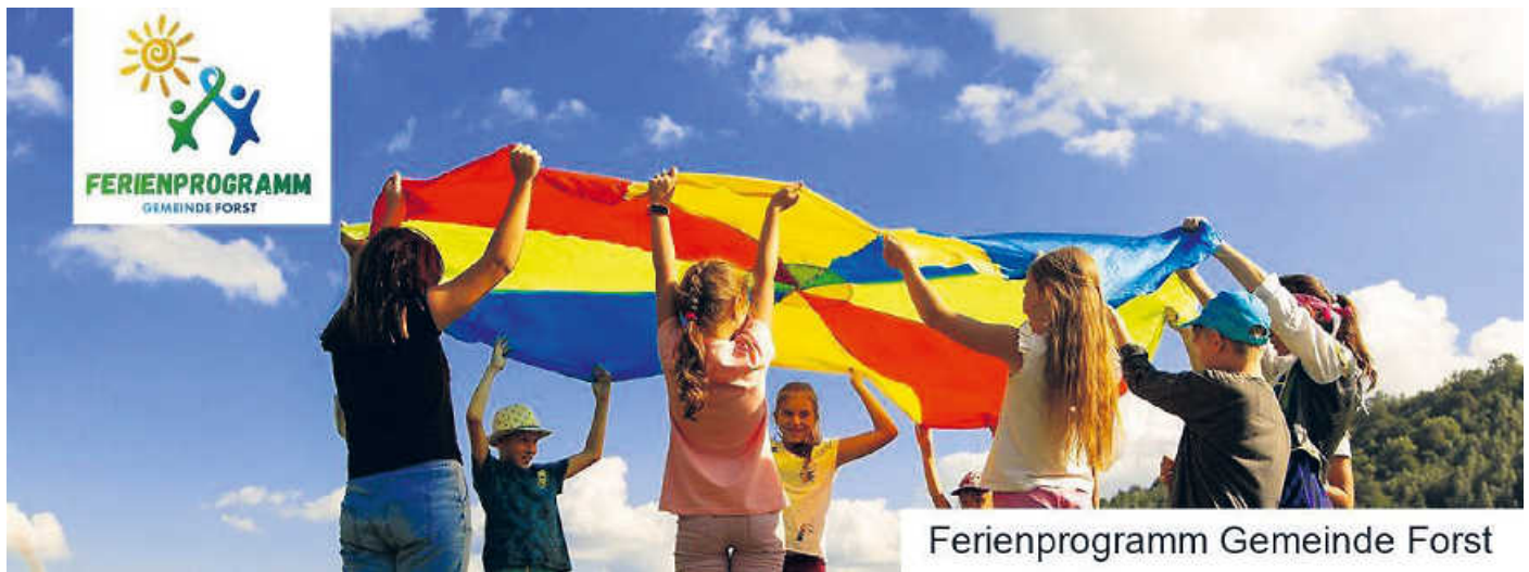
Ferienprogramm Gemeinde Forst

Bitte melden Sie sich unbedingt online an, um für Ihr Kind die schönsten und spannendsten Angebote zu sichern. Alle Veranstaltungen müssen vorab gebucht sein, und sie müssen eine Bestätigung erhalten haben. Melden Sie sich bis zum 06.07.2023 an. „Forst first“ lautet die Devise. Am 07.07.2023 verlost das System die Angebotsplätze, ab dem 08.07.2023 werden Restplätze auch an auswärtige Kinder vergeben.