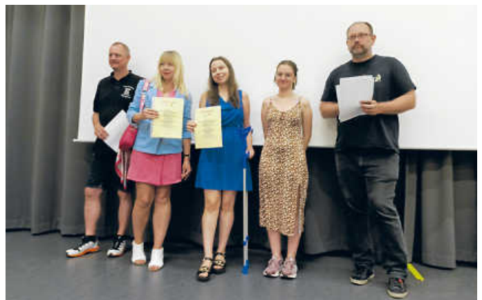
Siegerehrung der Damen