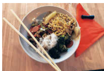
Das Ergebnis sieht lecker aus

Am letzten Mittwoch wurde eifrig geschnibbelt im Jugendhaus. Karotten, Lauch, Zuckerschoten, Brokkoli und vieles mehr haben die kleinen Köche vorbereitet, um dann alles mit Sojasoße zu einer tollen Gemüsepfanne zusammenzuführen. Dazu gab es Basmatireis und Mie-Nudeln.