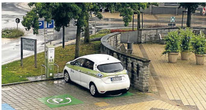
ZEO-Station beim Rathaus am Kirchplatz

In der Region Bruchsal gibt es im Rahmen des ZEO Carsharings über 70 Elektroautos zum Leihen, darunter zwei Fahrzeuge in Forst. Die Modellpalette ist breit. Sie können aus der E-Flotte vom Kompaktwagen bis zum Kleinbus mit 9-Sitzplätzen auswählen. Der Anbieter garantiert attraktive Tarife und einfache Handhabung. Eine Anmeldung ist einfach unter www.zeo-carsharing.de in allen Bürgerbüros der beteiligten Kommunen möglich. In Forst in der Ortsmitte (beim Rathaus) und in der Kronauer Allee/Ecke Hambrücker Straße (Ingenieurbüro IBE) stehen zwei moderne Renault Zoe für die Kunden bereit.