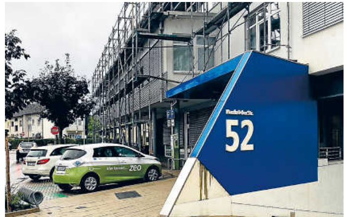
ZEO-Station Ecke Kronauer Allee/Hambrücker Straße

stellen dem regionalen Carsharing ihre E-Flotte zur Verfügung. Über einen einheitlichen Betreiber können diese dann von den Einwohner*innen jeder Gemeinde gebucht werden. So erreichen auch ländliche Gemeinden die nötige „kritische Masse“ für ein modernes Carsharingangebot. Koordiniert wird ZEO Carsharing von drei öffentlichen Institutionen (Regionale Wirtschaftsförderung Bruchsal GmbH, Energie- und Wasserversorgung Bruchsal GmbH und Umwelt- und Energieagentur Kreis Karlsruhe GmbH).